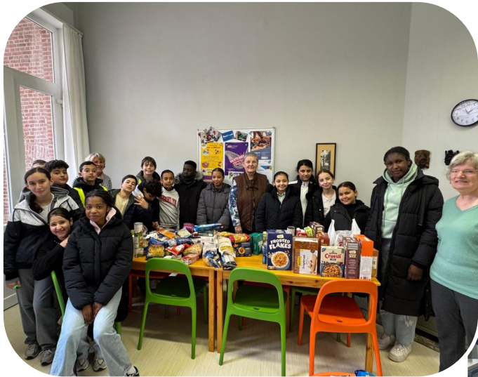
Project leesvuur in 4B: Peter Pan kwam tot leven!